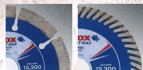
セグメント ターボ

切断能力の高い『セグメント』タイプと滑らかな切断面の『ターボ』タイプの用途に合わせて2タイプ!